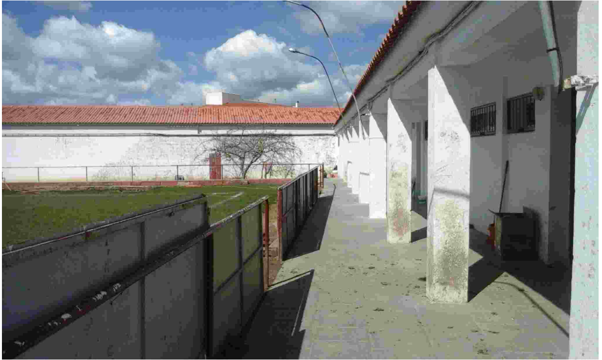
1ASEOS REFORMADOS. BANDA LATERAL IZQUIERDA.