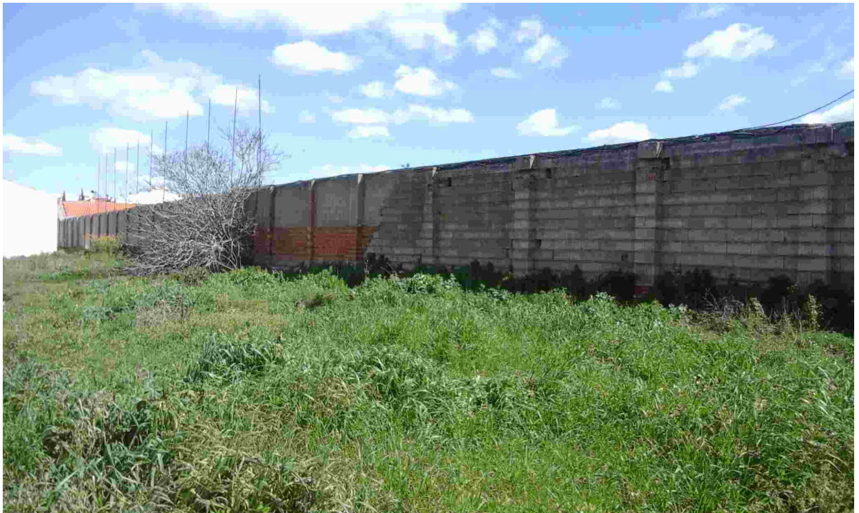
14ZONA DE AMPLIACIÓN