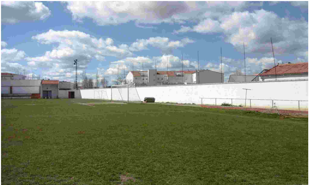
18ESTADO ACTUAL PARED TERRENOS COLINDANTES