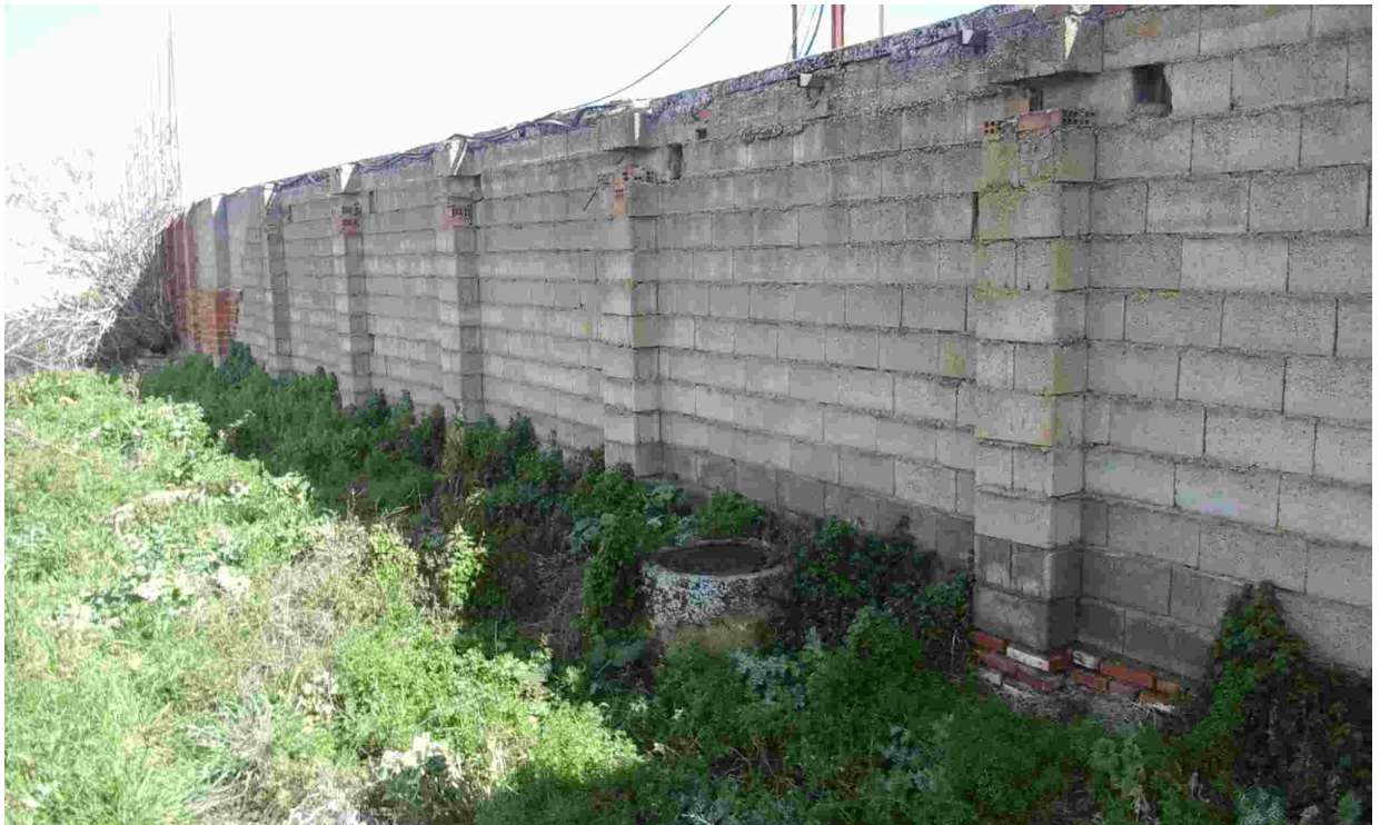
12PARED A DEMOLER. UBICACIÓN POZOS