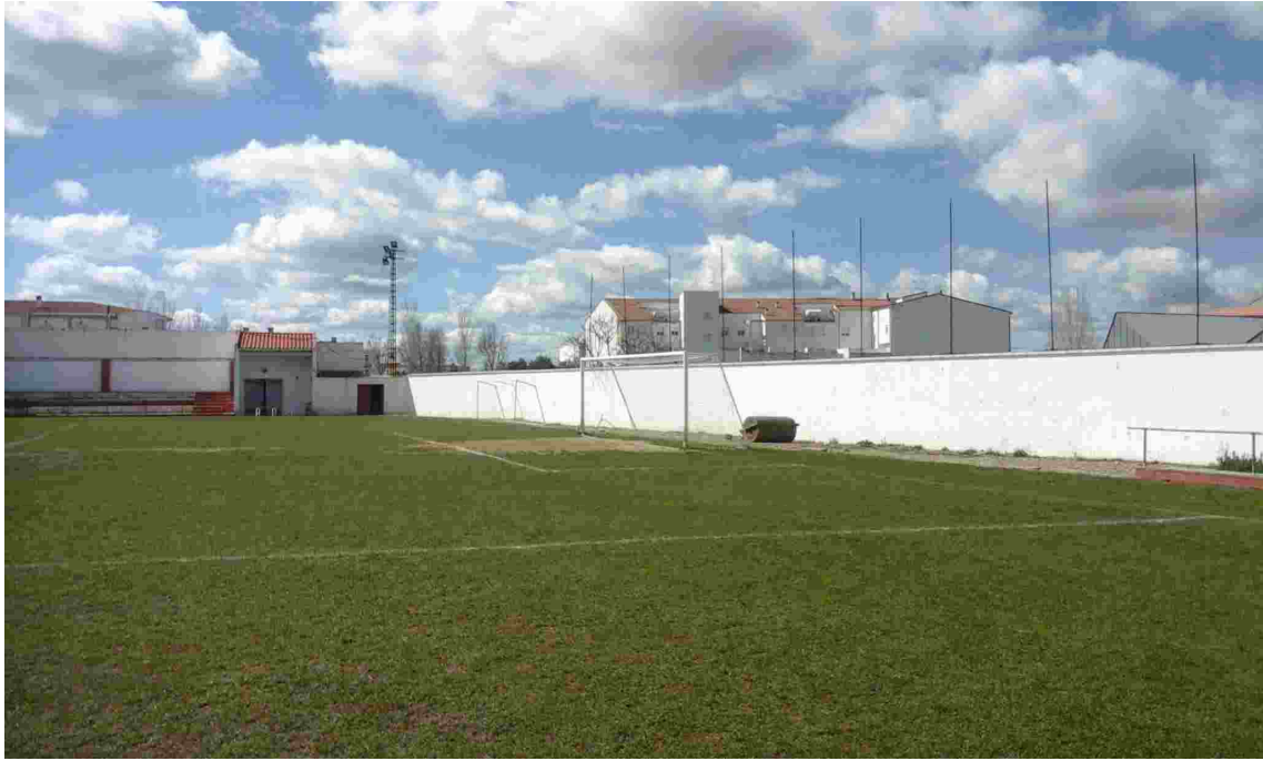
15DESCUADRE ESQUINA Y FONDO IZQUIERDO