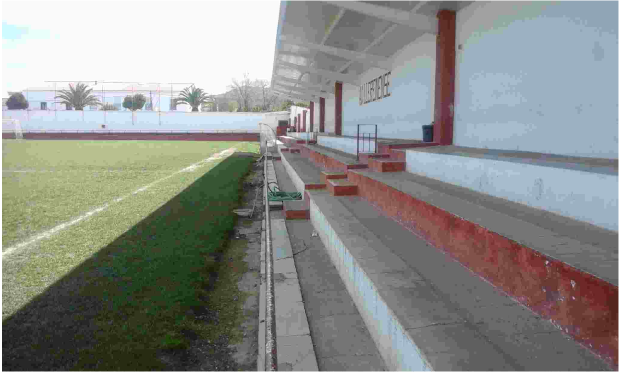
7 GRADAS EXISTENTES. BANDA LATERAL DERECHA