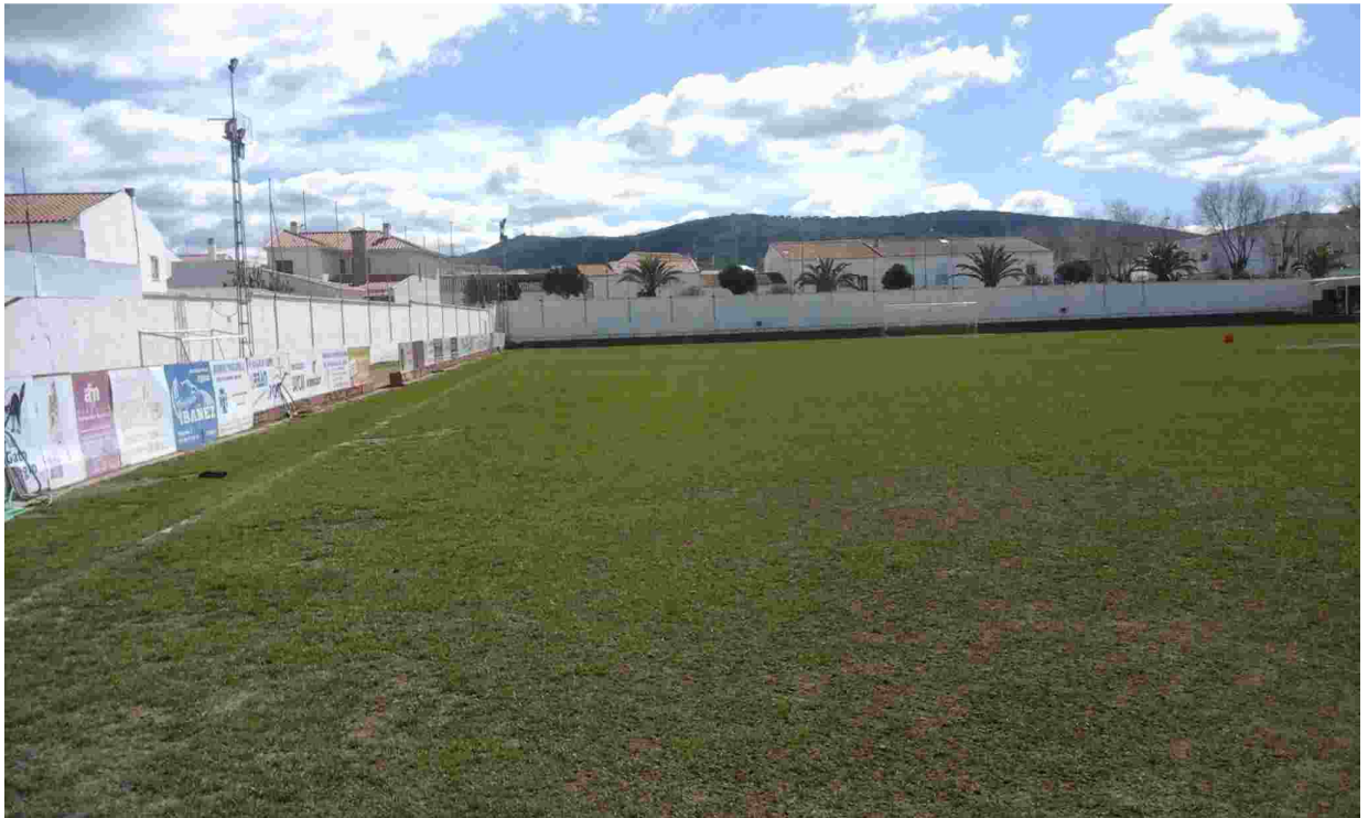
16ESTADO ACTUAL CAMPO DE FÚTBOL