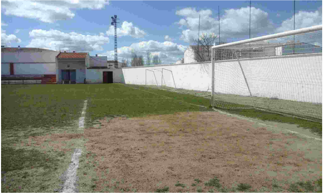
9ESQUINA DESCUADRADA A MODIFICAR