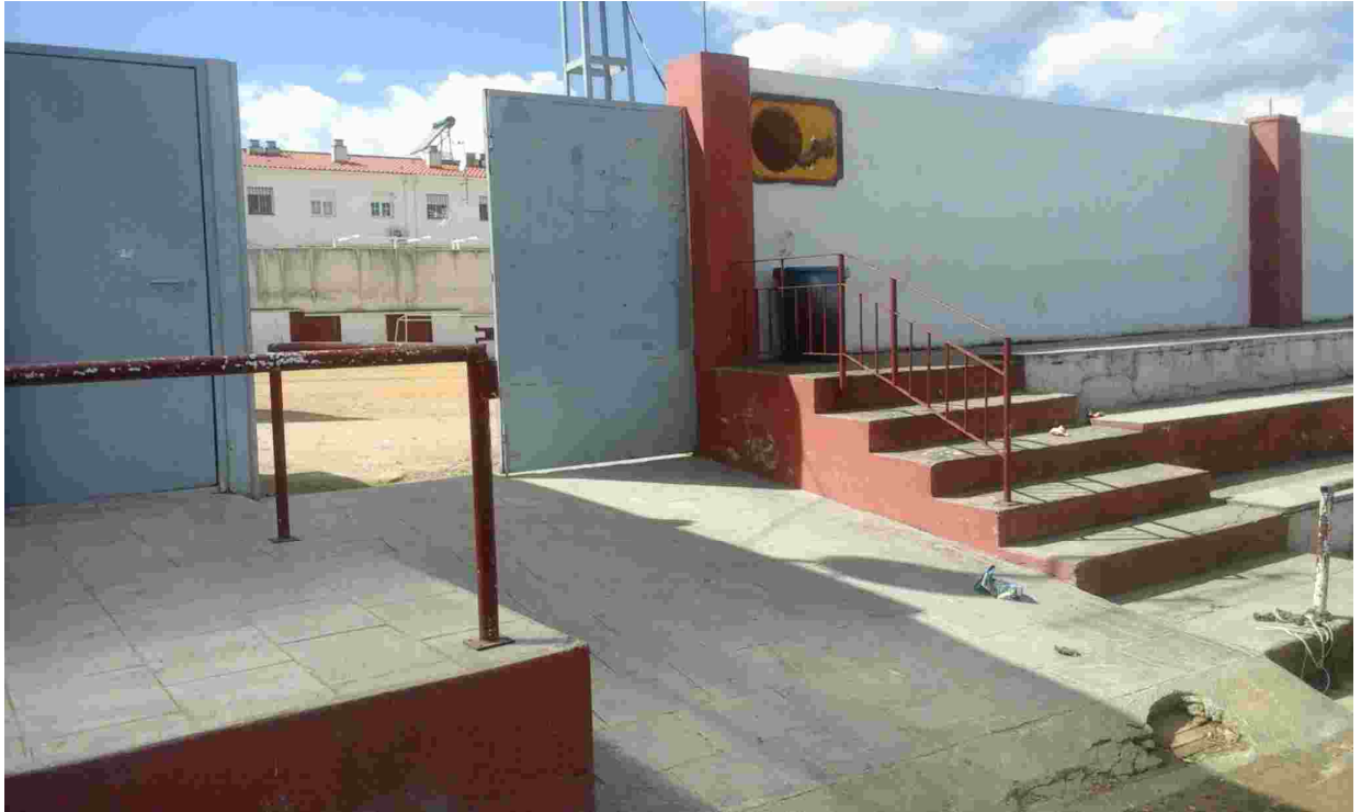
3ACCESO AL CAMPO DE FÚTBOL A MODIFICAR