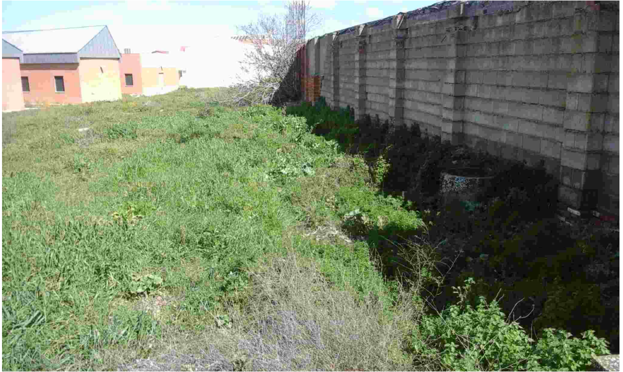
11TERRENO COLINDANTE OBJETO ACTUACIÓN. PARED A DEMOLER. POZO EXISTENTE.