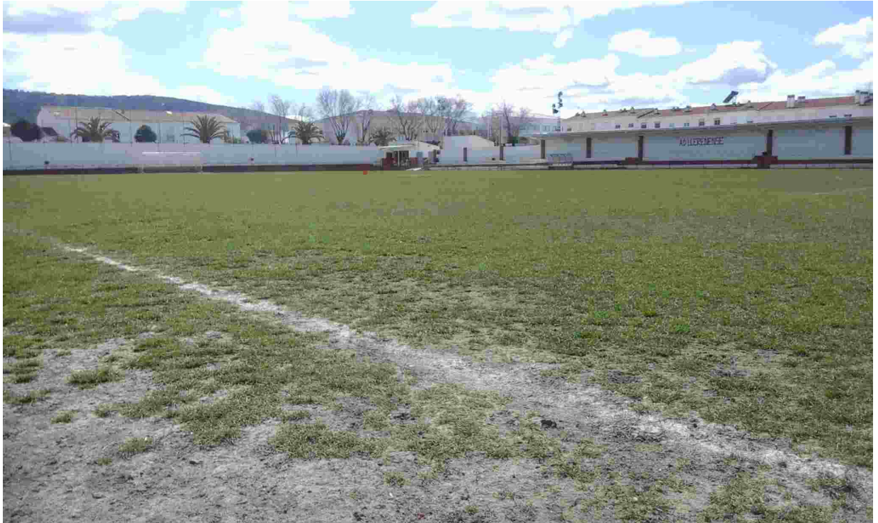
17ESTADO ACTUAL CÉSPED