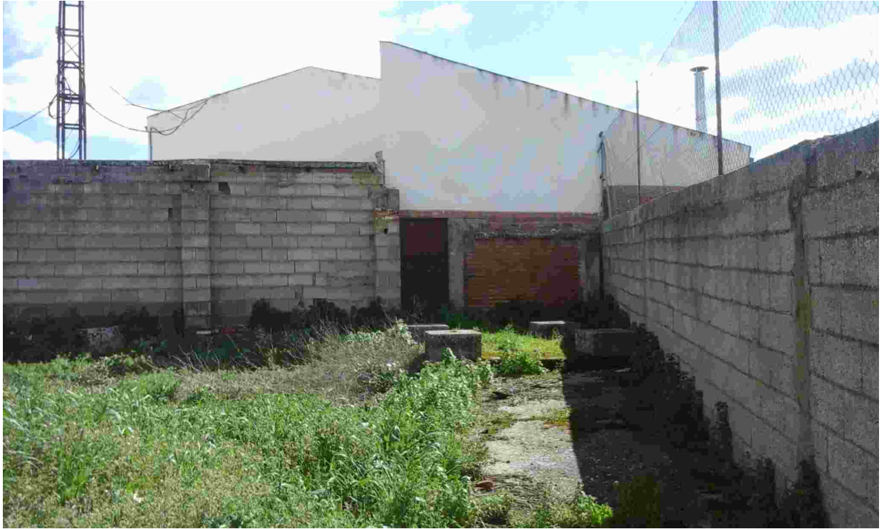
13ZONA AMPLIACIÓN TRASERA