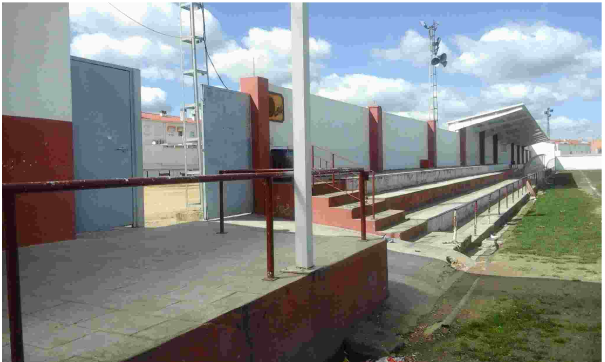
4ACCESO AL CAMPO DE FUTBOL Y GRADAS EXISTENTES BANDA LATERAL IZQUIERDA