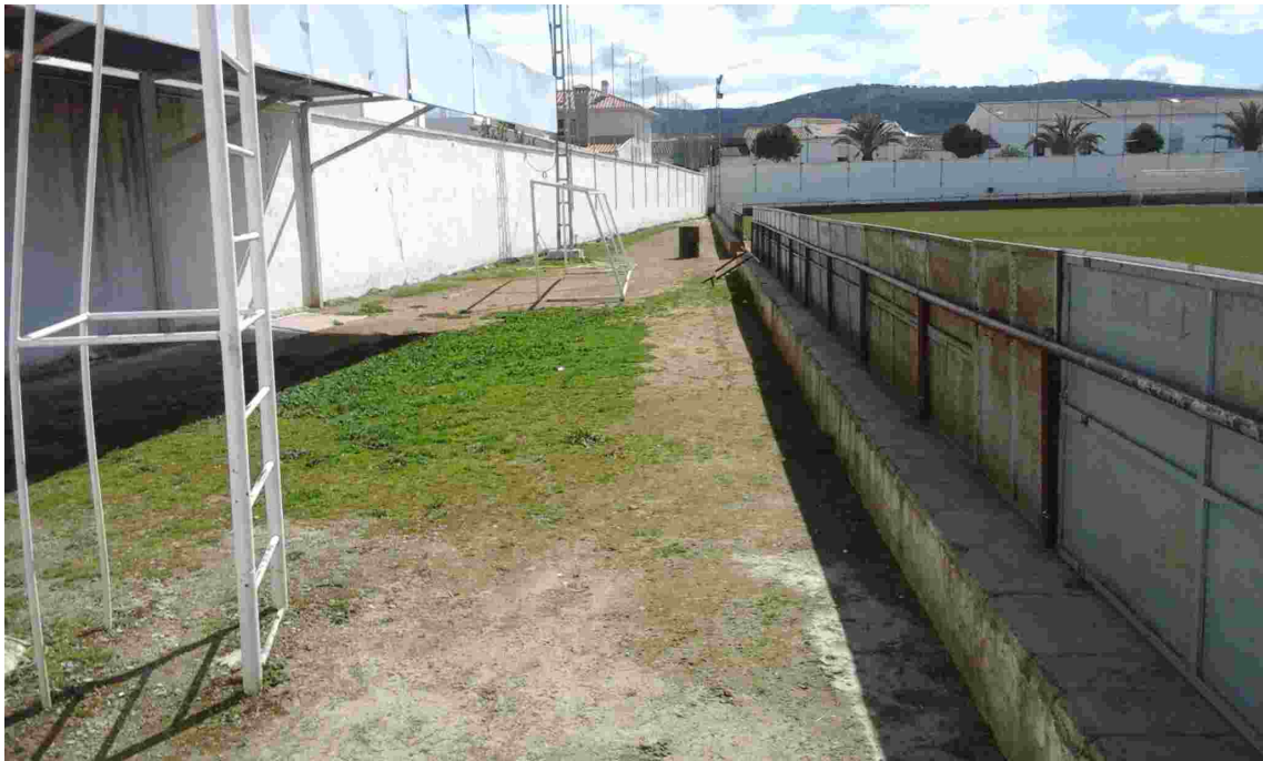
2BANDA LATERAL IZQ. POSTE ELÉCTRICO Y MURETE