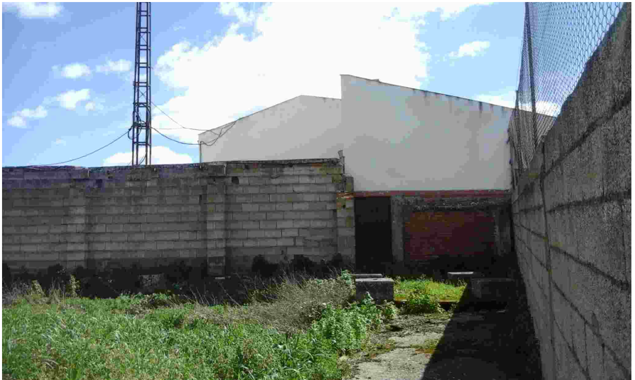
10TERRENO COLINDANTE OBJETO DE ACTUACIÓN. ESQUINA A MODIFICAR