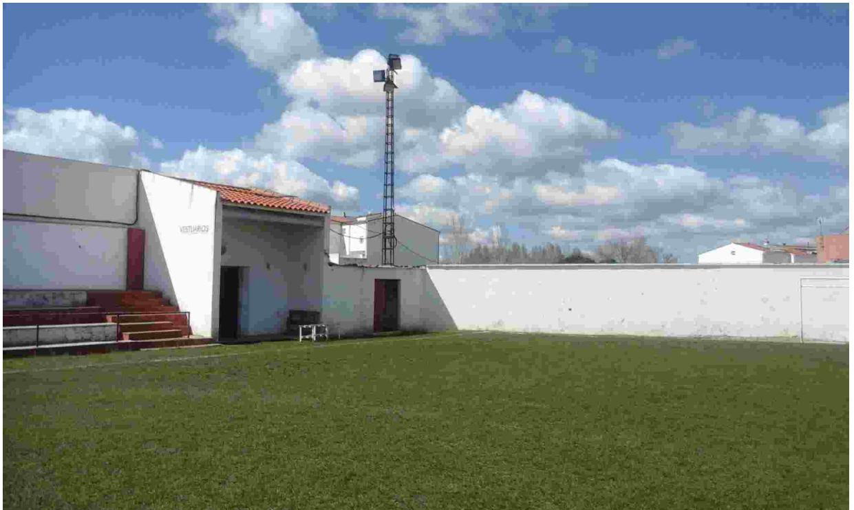
8 ASEOS NUEVOS. ESQUINA A MODIFICAR